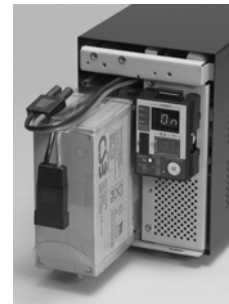
ユーザ様でもバッテリー交換可能