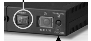
バッテリー交換表示LED